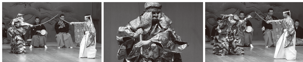
2019年 第六回演能空間「烏帽子折」公演より